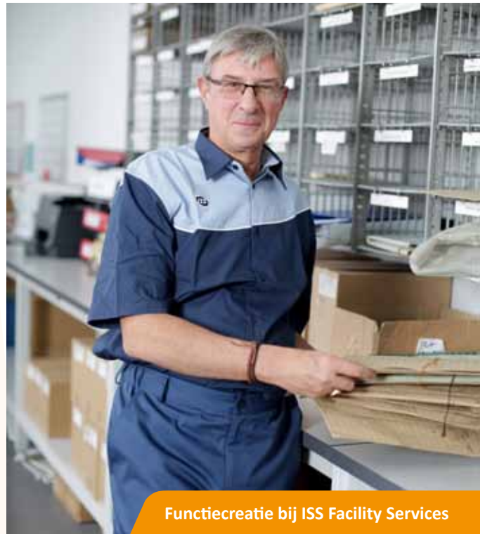
Functiecreatie bij ISS Facility Services

ISS werkt al langere tijd met medewerkers met een afstand tot de arbeidsmarkt. De facility diensten die ISS levert zijn bij uitstek geschikt voor deze werkzoekenden, aldus Vos. ISS richt zich op verschillende werkzoekenden, vallend onder de participatiewet (onder andere Wajong, indicatie afspraakbanen, jongeren, vluchtelingen met een status en mensen die langdurig in de bijstand zitten). Peter: “Wij willen de brede doelgroep met een afstand